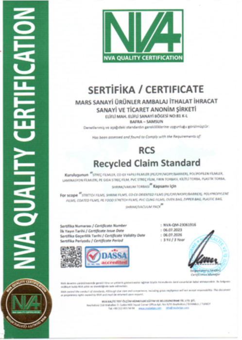
Recycled Claim Standard