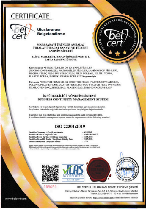
ISO 22301:2019 Certificado de calidad