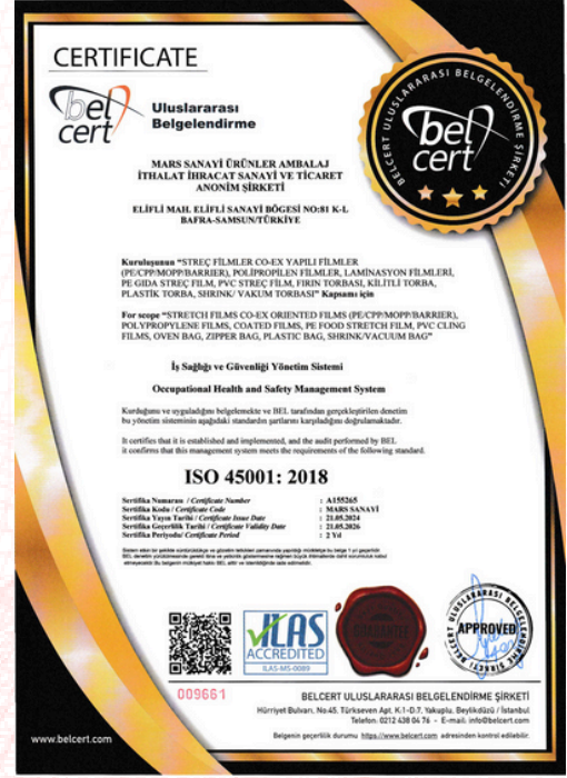
ISO 45001:2018 Certificado de calidad