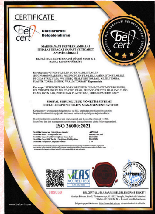
ISO 26000:2021 Certificado de calidad