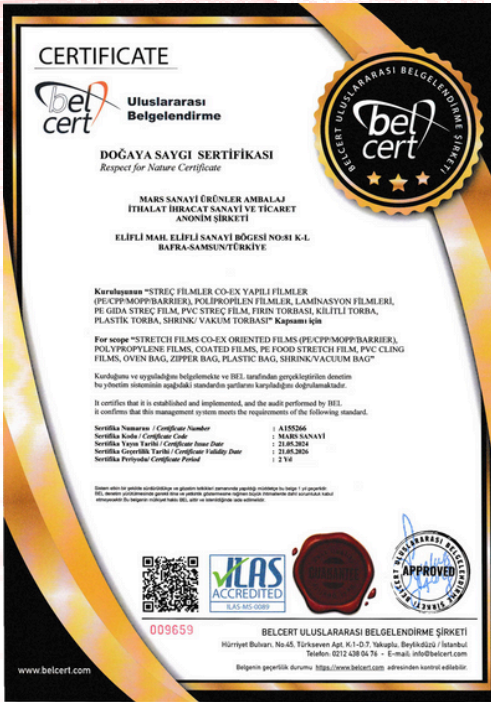
Certificado de Respeto a la Naturaleza