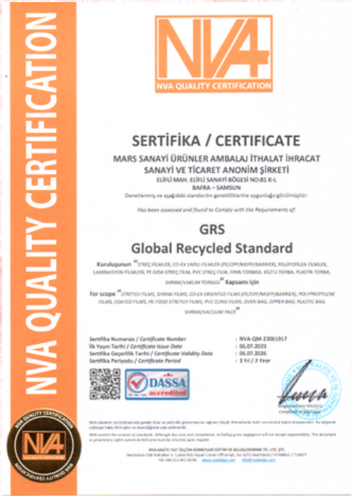
Global Recycled Standard Certificado de calidad