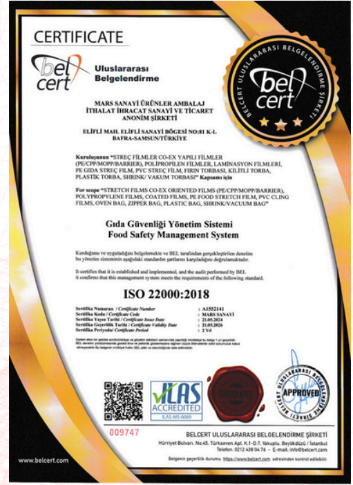
ISO 22000:2018 Certificado de calidad