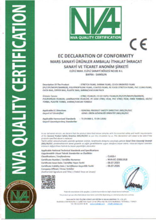
CE Europe Certificado de Declaración