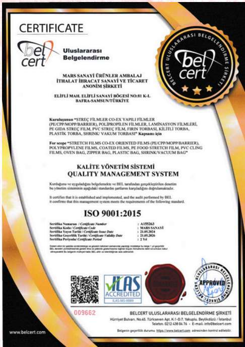
ISO 9001:2015 Certificado de calidad