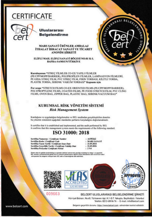
ISO 31000:2018 Certificado de calidad