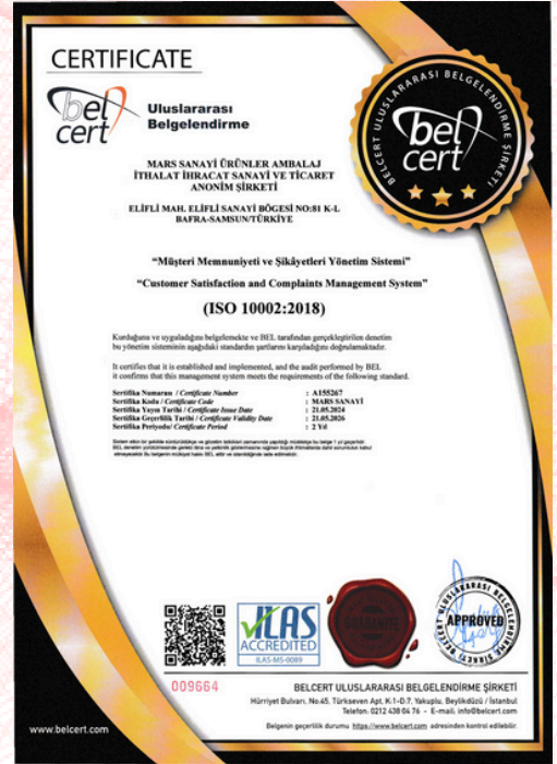
ISO 10002:2018 Certificado de calidad